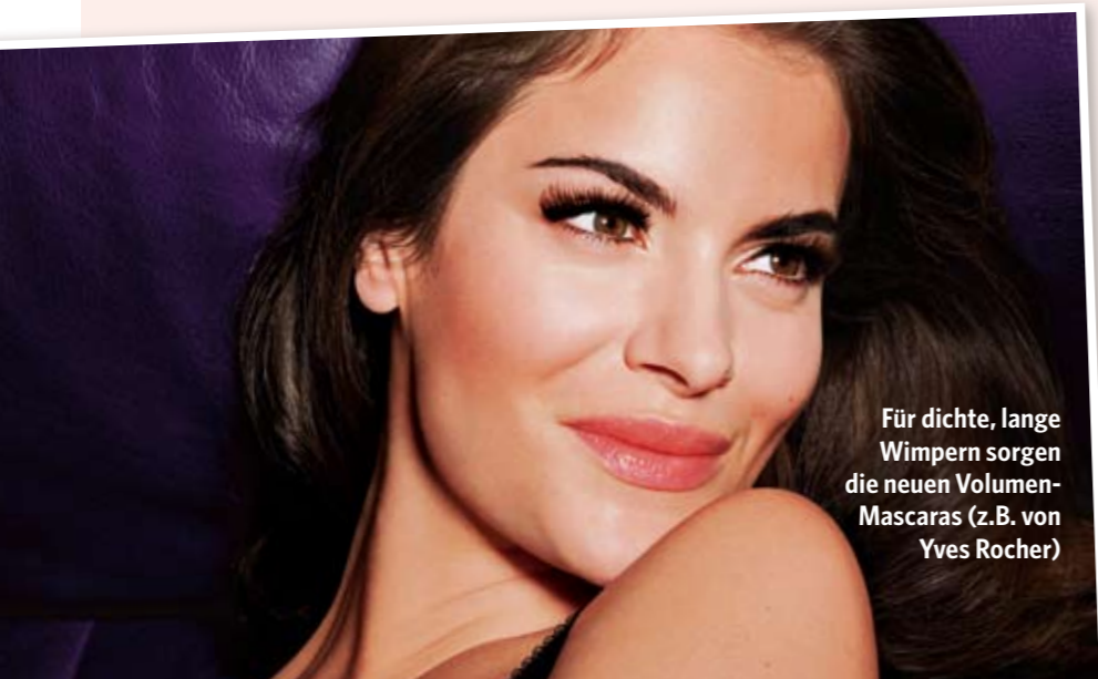
Für dichte, lange Wimpern sorgen die neuen Volumen-Mascaras (z.B. von Yves Rocher)

Dass Ihr Augapfel täglich 100 000 Mal in Aktion tritt und Ihre Lider ca. 15 000 Mal blinzeln? Weil dafür immerfort ca. 20 Muskeln im Einsatz sind, wird natürlich auch die Haut der Augenpartie in hohem Maße beansprucht. Dabei ist sie besonders dünn und enthält viel weniger Elastin- und Kollagenfasern als andere Gesichtsareale. Darum werden die Zeichen der Zeit hier auch zuerst sichtbar. Gründe genug, die Augenpartie gut zu pflegen und das Make-up schonend einzusetzen.